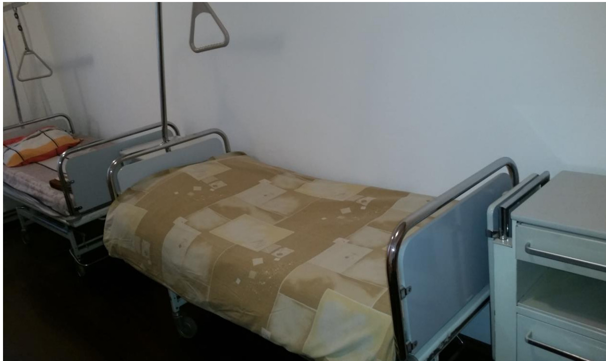
Slika 6. Noćni ormari sa daskom za hranjenje i kreveti sa rampama za podizanje

U predhodnim godinama Dom se obnovio sa profesionalnim bolničkim krevetima i noćnim ormarićima koji imaju i dasku za hranjenje korisnika. Svi kreveti imaju i rampe za samostalno podizanje korisnika koji to nisu u mogućnosti, a izgled kreveta i noćnih ormara je prikazan na slikama 5 i 6. Kreveti i noćni ormari su donacija dobrih ljudi iz Njemačke.