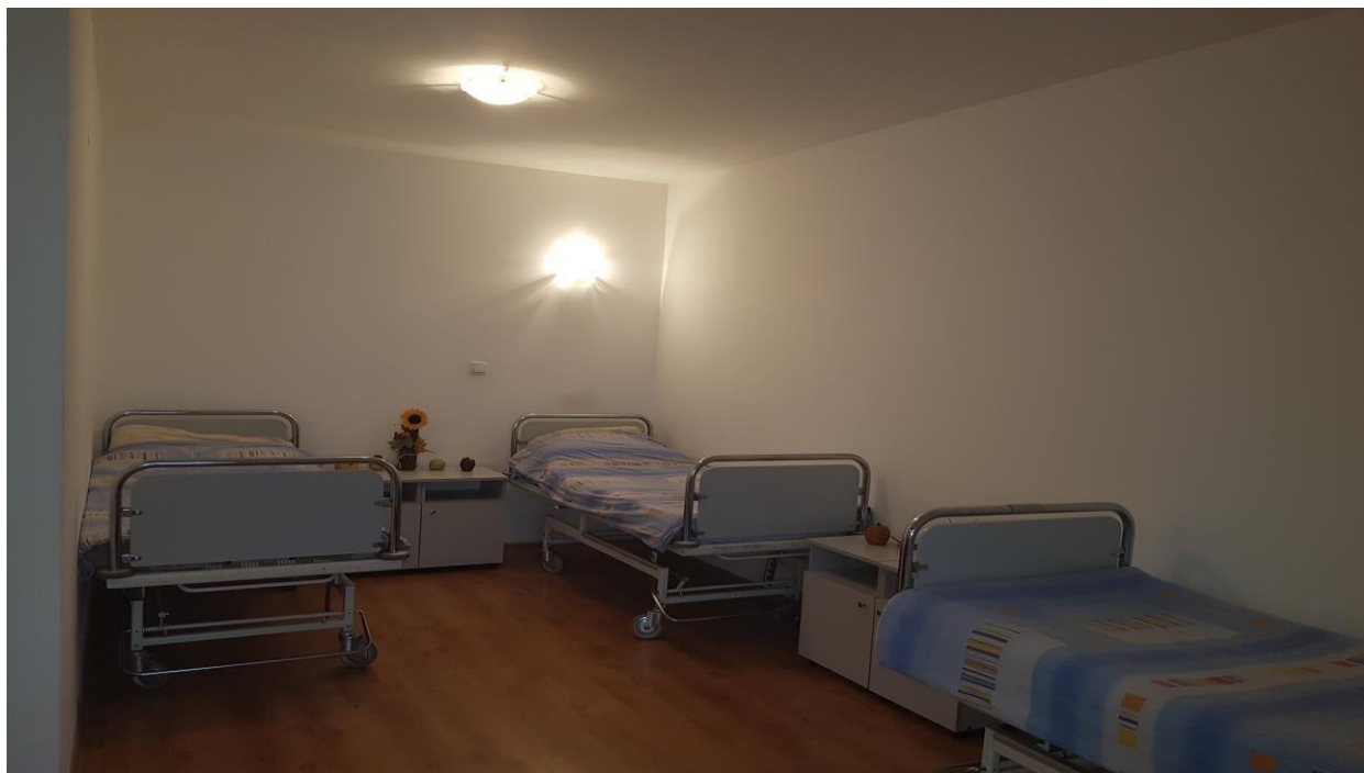
Slika 5. Trokrevetna soba Doma