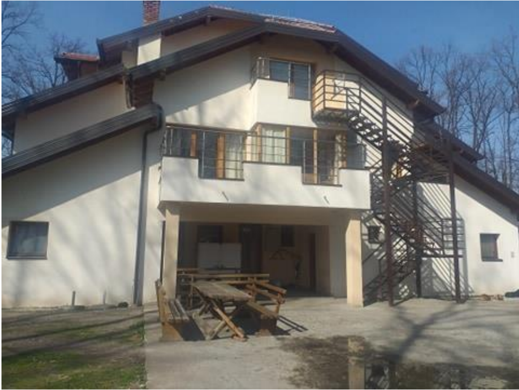
Slika 2. Dom za starija lica na Preslici