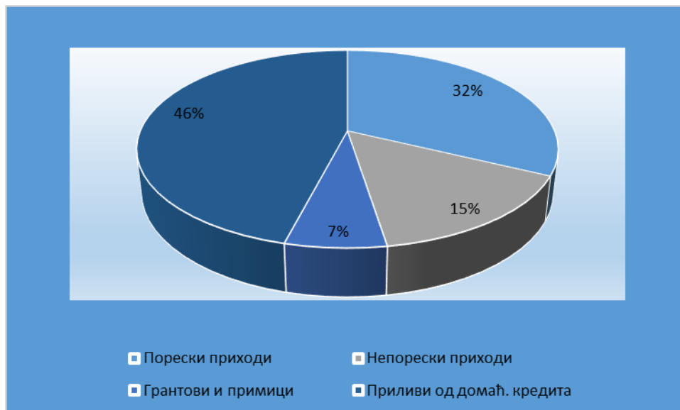
Учешће у структури прихода 01.01- 31.12.2020.