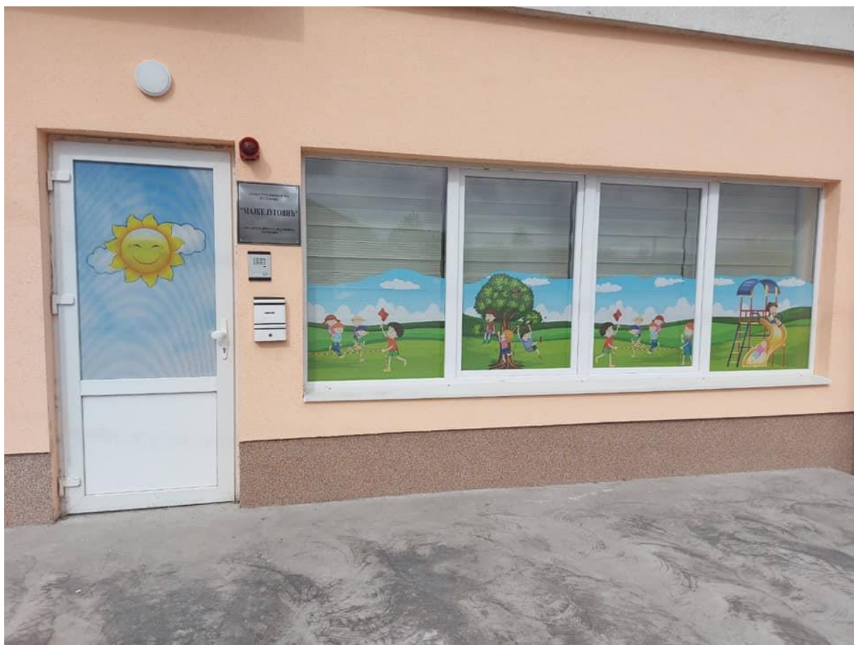
Објекат Установе у ул. Озренских одреда 60, Петрово

Организациона јединица – Дјечији вртић у ул. Озренских одреда 60, Петрово је новооснована организациона јединица установе на основу Одлуке о измјени и допуни Одлуке о усклађивању организације и рада Јавне предшколске установе „Мајке Југовић“ Добој, Скупштине града Добоја број: 01-013-245/21 од 25.05.2021.године и Одлуке о оснивању организационе јединице установе – Дјечијег вртића у ул.Озренских одреда 60 Петрово у саставу ЈПУ „Мајке Југовић“ Добој, Управног одбора установе, број: 298/2021 од 29.04.2021.године. Планирано је да објекат почине са радом у току мјесеца октобра 2021.године.