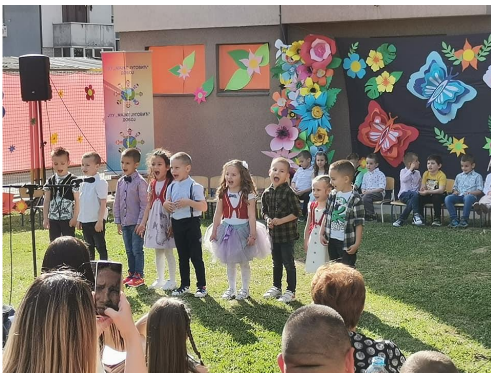
Završna Priredba predškolaca

Uzeli smo učešće u „Dani saobraćaja“ i obilježavanju „Dana grada Doboja“. Zbog epidemiološke situacije neka dešavanja obrađena su kroz redovne učeće aktivnosti unutar ustanove. Korisnici ustanove su učestvovali na konkursima za djecu predškolskog uzrasta.