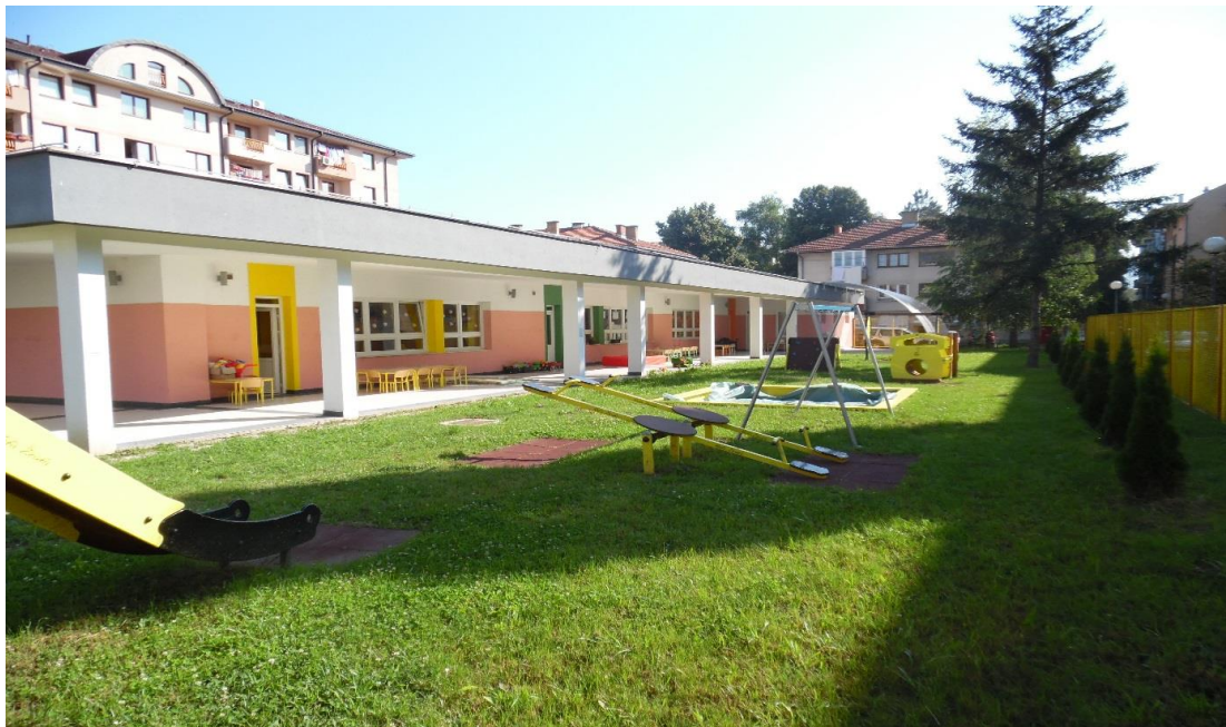
Objekat Ustanove u ul.Kneza Lazara

Organizaciona jedinica – Dječiji vrtić u Ul. vojvode Mišića bb - Stari Grad takođe je u poplavi od 15.05.2014. godine pretrpio ogromnu štetu, ali uz pomoć donatorskih sredstava Kancelarije za saradnju u oblasti odbrane Ambasade SAD u BiH, objekat je renoviran i ponovo počeo sa radom 01. 09. 2016. godine.