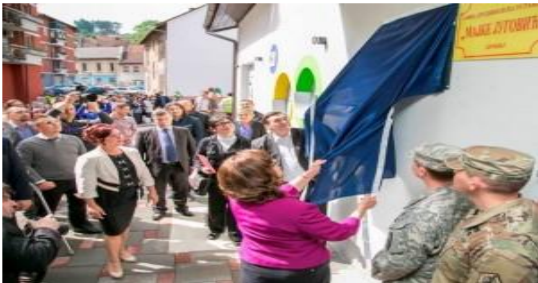
Objekat Ustanove u ul.Vojvode Mišića

Organizaciona jedinica – Dječiji vrtić u Ul. vojvode Mišića bb - Stari Grad takođe je u poplavi od 15.05.2014. godine pretrpio ogromnu štetu, ali uz pomoć donatorskih sredstava Kancelarije za saradnju u oblasti odbrane Ambasade SAD u BiH, objekat je renoviran i ponovo počeo sa radom 01. 09. 2016. godine.