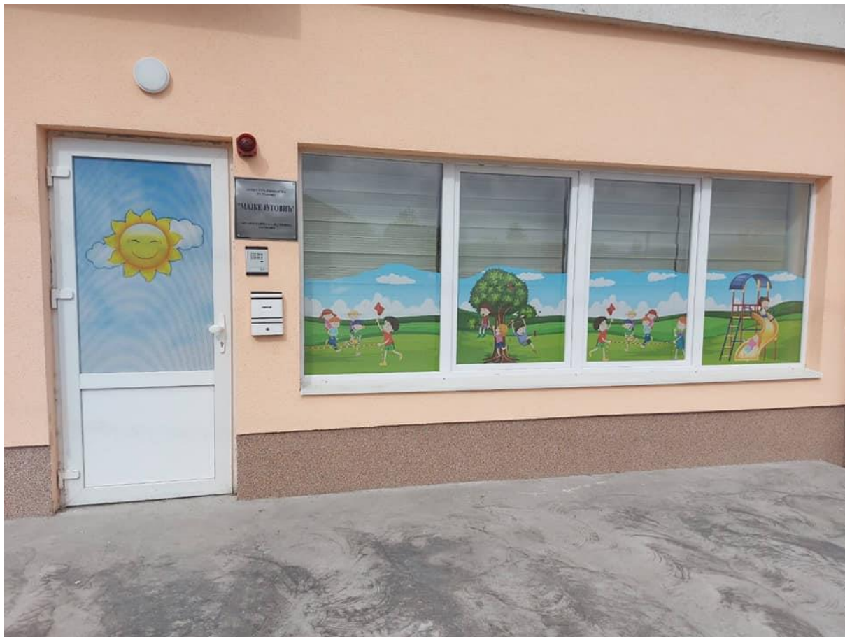
Objekat Ustanove u ul. Ozrenskih odreda 60, Petrovo

Jugović“ Doboj, Upravnog odbora ustanove, broj: 298/2021 od 29.04.2021.godine. Planirano je da objekat počine sa radom u toku mjeseca oktobra 2021.godine.