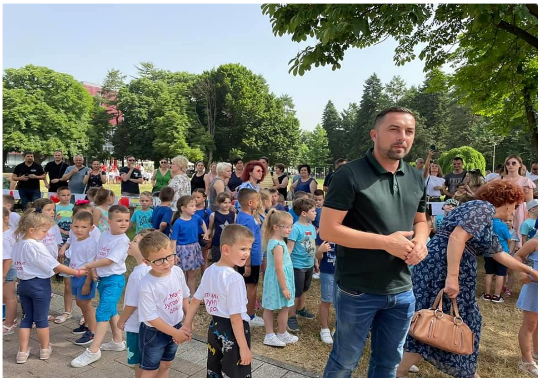
Obilježavanje „Dana Grada Doboja“

Van ustanove u saradnji sa osnivačem i drugim ustanovama iz javnog života grada Doboja, djeca su učestvovala na manifestaciji „Dan bez automobila“.