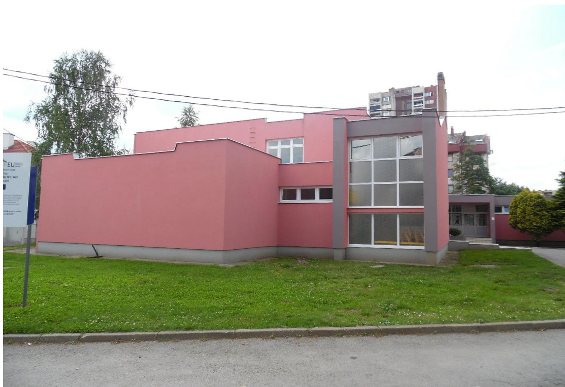
Objekat Ustanove u ul.Karađorđeva 50

Organizaciona jedinica – Dječiji vrtić - Karađorđeva ulica br. 50, gdje je i sjedište ustanove, je osnovan 1980, a poslije rata je osposobljen donatorskim sredstvima. U poplavi od 15.05.2014.godine objekat je pretrpio ogromnu štetu, ali uz pomoć sredstava Evropske Unije putem UNDP-a i UNICEF-a, kao i ostalih donatora, objekat je renoviran i ponovo počeo sa radom 15. 12. 2014. godine.