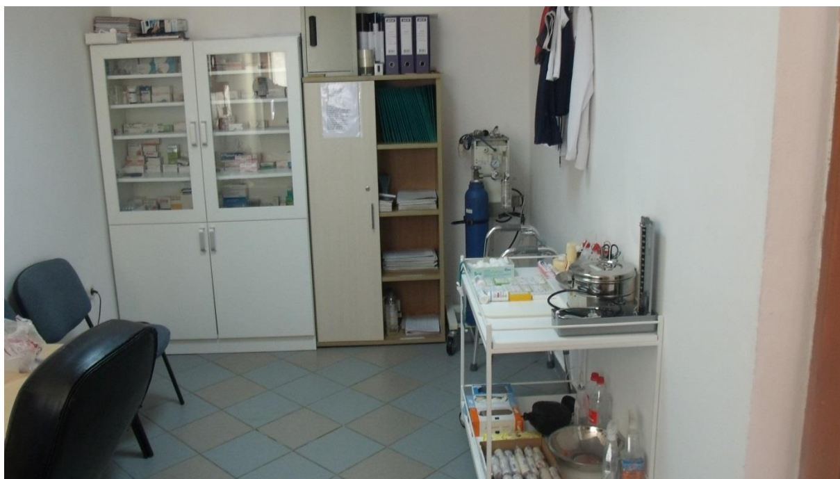
Слика 9. Амбуланта Дома

Здравствена заштита корисника се врши у адекватно опремљеној амбуланти Дома.