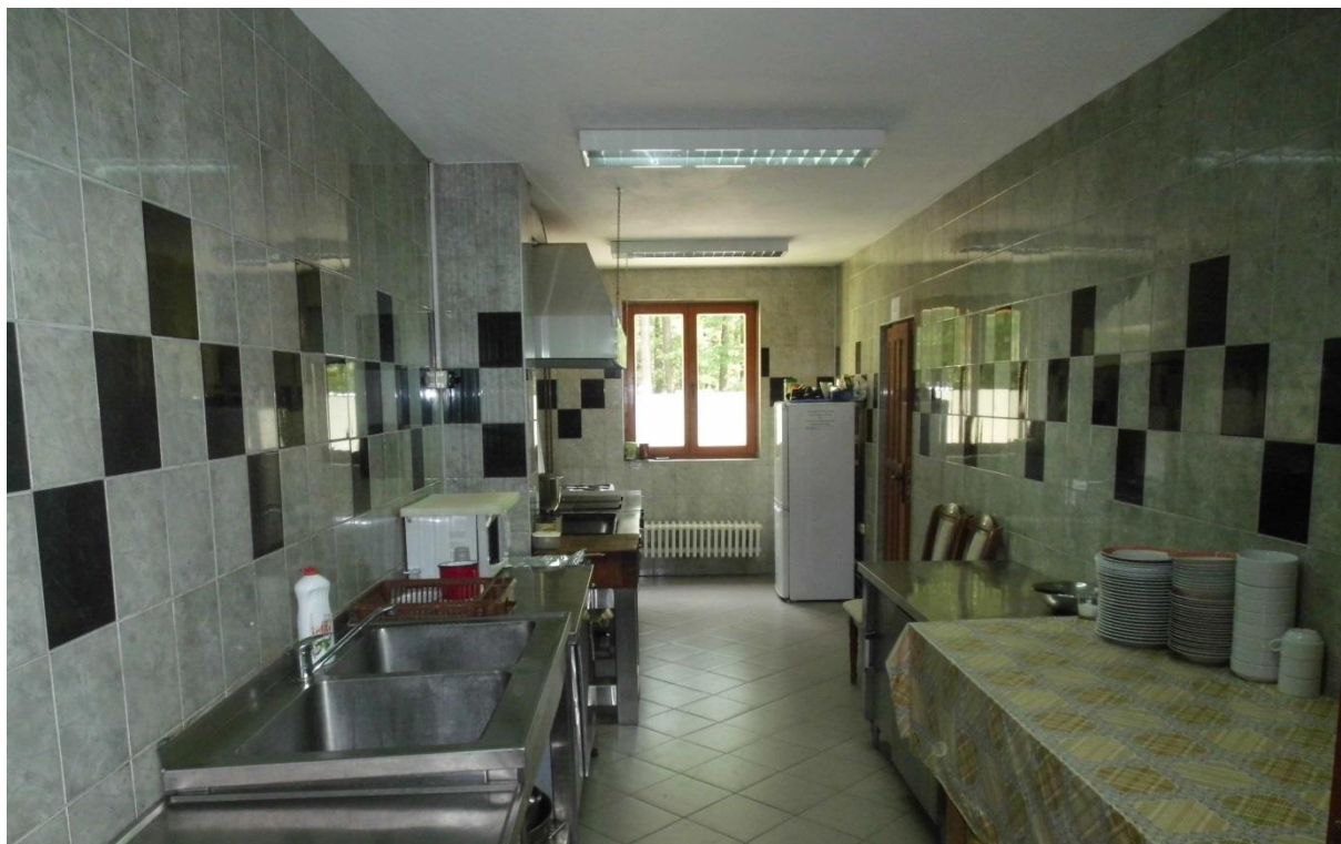
Слика 8. Кухиња Дома

На слици 8. је приказана кухиња за припрему оброка која је опремљена професионалним уређајима и посуђем.