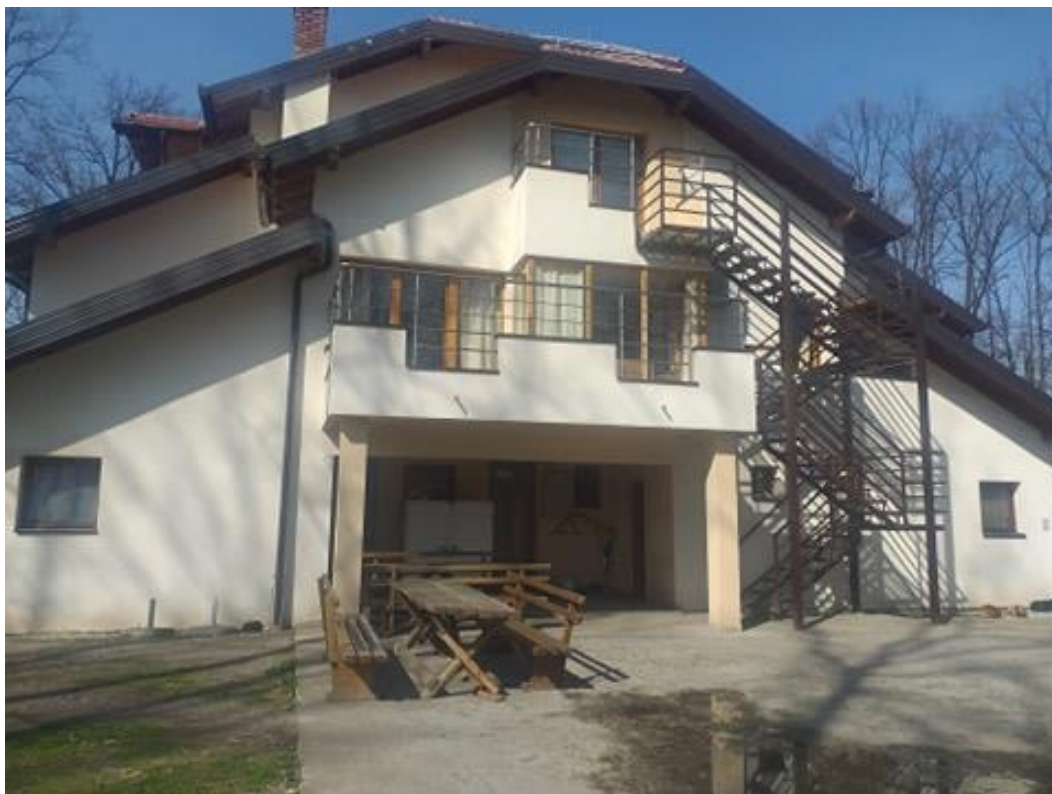
Слика 2. Дом за старија лица на Преслици