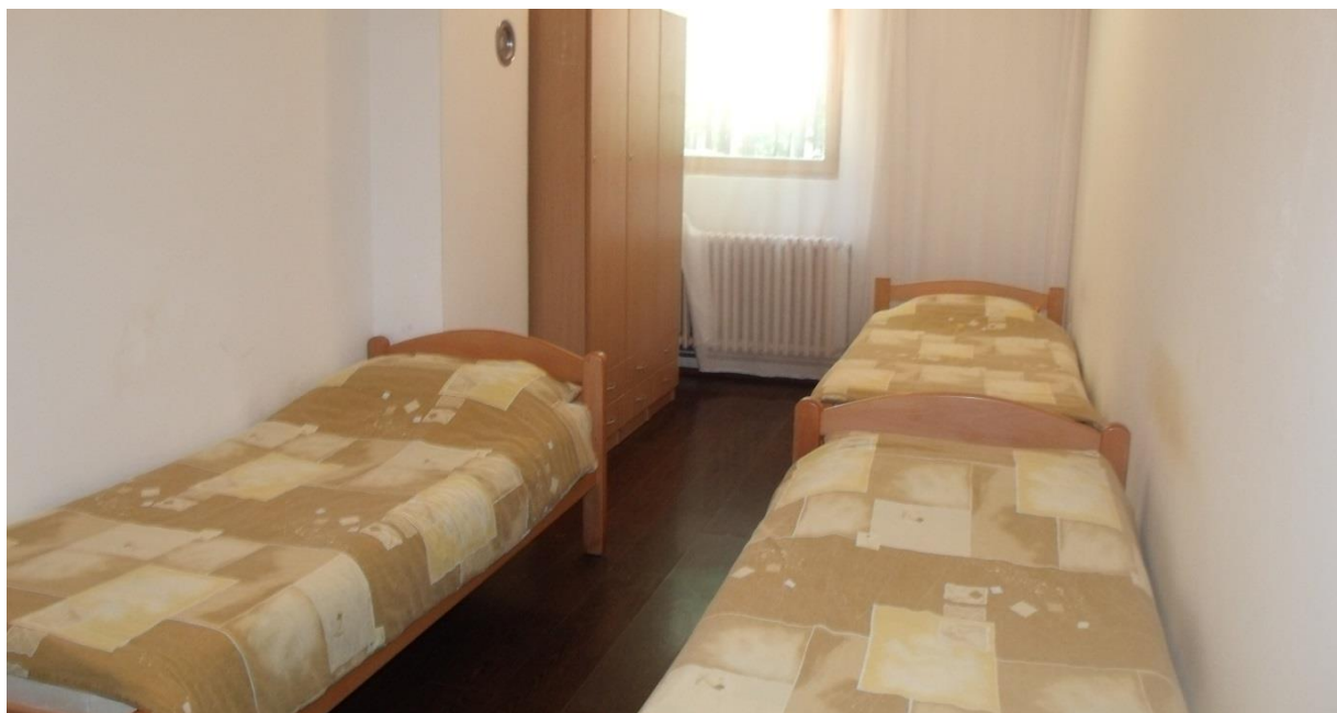
Слика 4. Трокреветна соба Дома

Корисници су смјештени у собама које су опремљене потребним намјештајем и које су прилагођене потребама самих корисника.