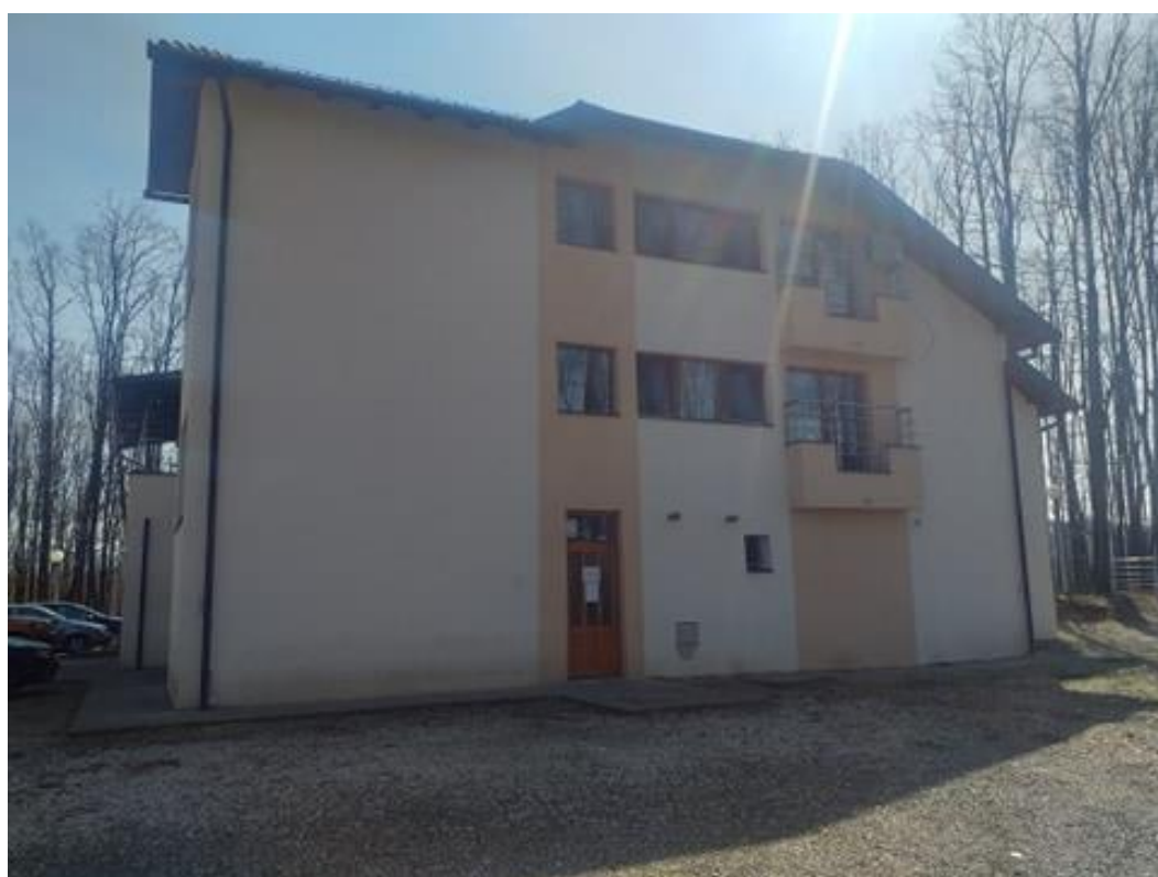
Слика 3. Дом за старија лица на Преслици