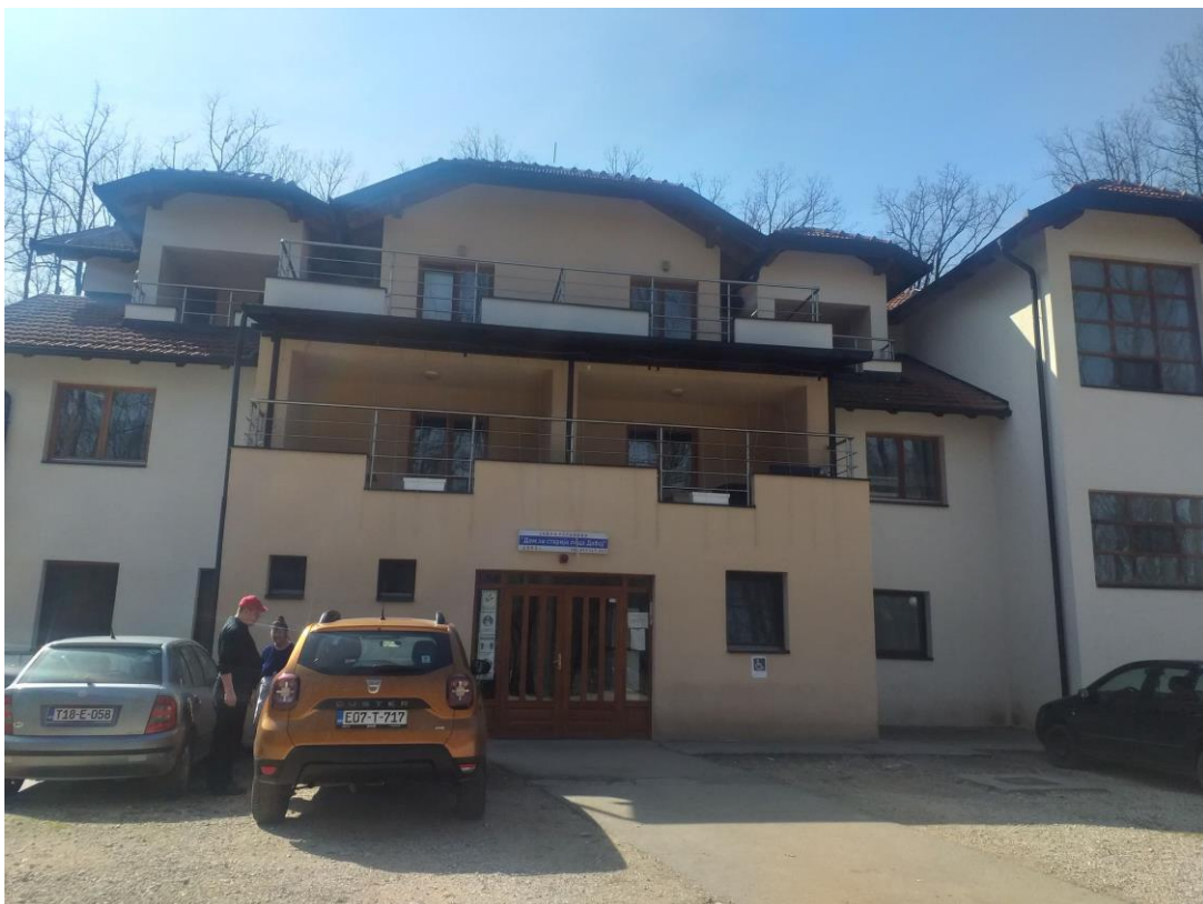
Слика 1. Дом за старија лица на Преслици

Основна дјелатност Дома је социјална заштита старијих лица коју Дом остварује тако што својим корисницима обезбјеђује становање, исхрану прилагођену корисницима, његу 24х, одијевање, здравствену заштиту (услуге љекара специјалиста и лијекови), културно-забавне, рекреативне, радно-окупационе и друге активности, услуге социјалног рада и друге услуге зависно од потреба, способности и интересовања корисника.