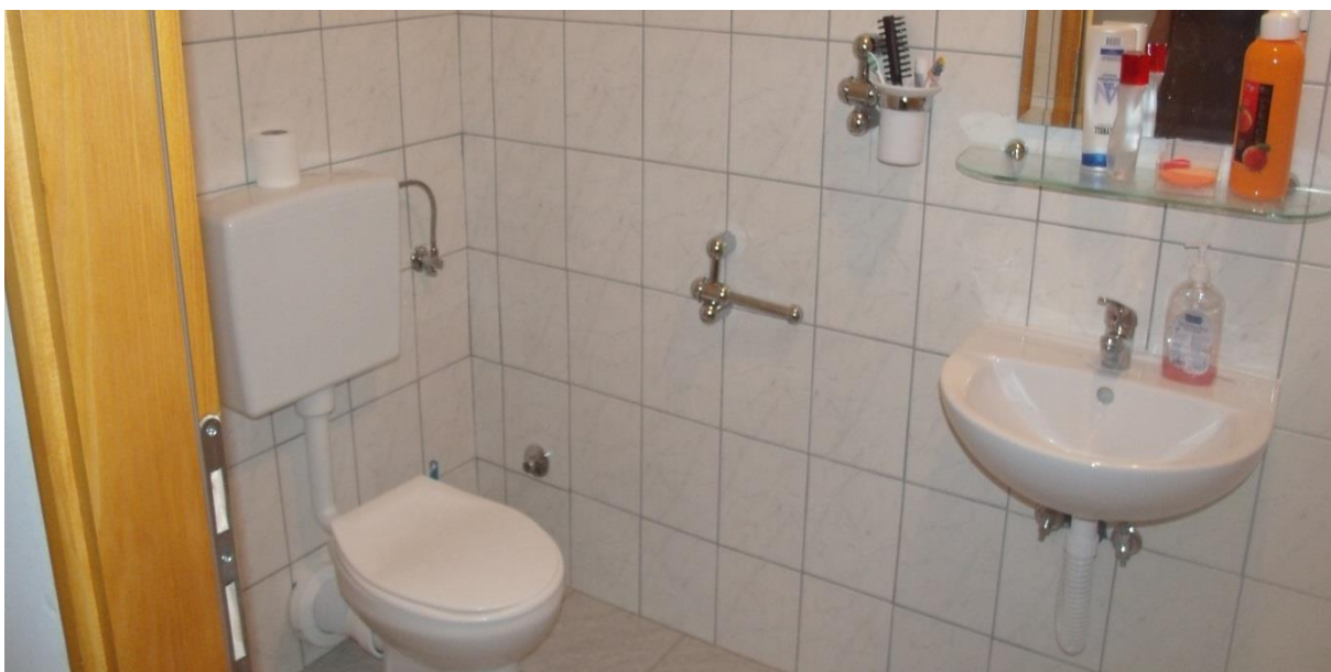
Слика 7. Купатило Дома

Сви кревети у собама су подесиви по висини, а све у сврху удобности корисника. Такође поред намјештаја, води се рачуна да је све прилагођено потребама корисника па тако да свака соба засебно има опремљено купатило и мокри чвор ( слика 7.).