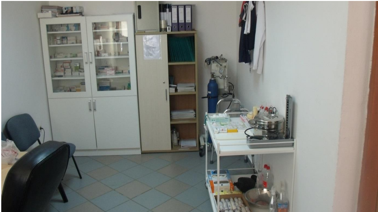
Slika 9. Ambulanta Doma

Zdravstvena zaštita korisnika se vrši u adekvatno opremljenoj ambulanti Doma.