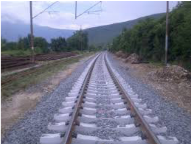
Пружни правац Добој- Бања Лука

1) Распутница Спреча - Добој - Предграђе (демонтирана 760м).