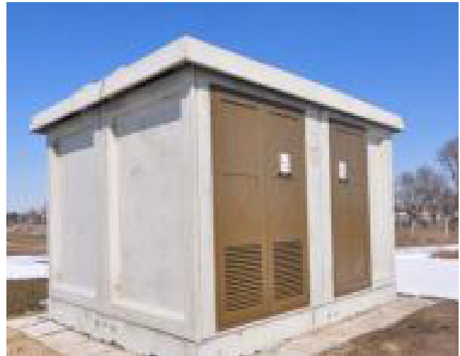
Трафо станица 110 kV на подручју Града Добој

Из трансформаторских станица градско подручје се напаја струјом путем подземних каблова, док се приградска и сеоска подручја се напајају електричном енергијом путем далековода. На сеоским подручјима изграђене су трафо станице са решеткастим металним стубовима.