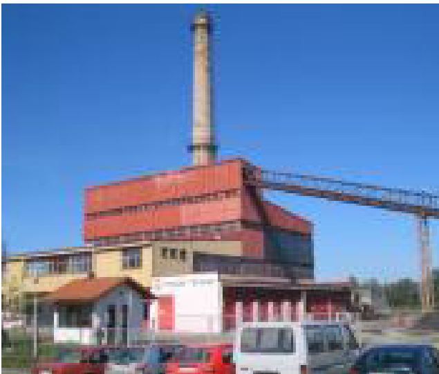
Градска топлана Придјел-Добој

Градска топлана је највећи термоенергетски објекат у граду, који је намјењен за производњу и дистрибуцију топлотне енергије помоћу котловског постројења, односно производње топле воде која се системом пумпног постројења дистрибуира до топлотних подстанци на подручју града. Инсталације за допремање топле воде изведене су преко подземних хоризонталних цјевовода - магистралних водова разгранатих по граду у више праваца.