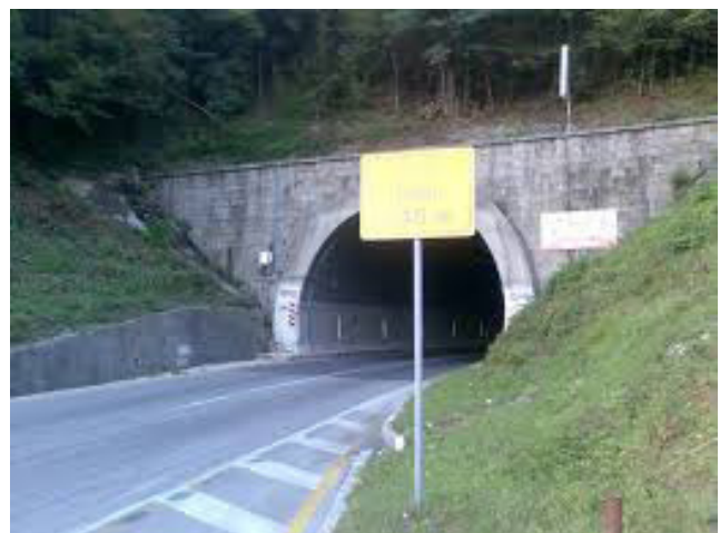
Тунел Станић Ријека

На магистралном путу М-17 који пролази кроз насељено мјесто Макљеновац на ријеци Усори налази се мост, а нешто даље на истом путу налази се мањи мост на каналу потока Лијешањ. У насељеном мјесту Руданка на магистралном путу М-17 налази се надвожњак жељезничке пруге Добој-Бања Лука. У насељеном мјесту Баре изграђен је мост на ријеци Босни који спаја магистрални пут М-17 и регионални пут Добој-Кожухе-Модрича. На излазу из Добоја недалеко од Робне пијаце изграђен је мост на ријеци Босни који повезује магистрални пут М-17 и магистрални пут М-7 Добој-Тузла. На регионалном путу Добој-Рјечица-Маглај у насељеном мјесту Рјечица налази се надвожњак испод којег пролази жељезничка пруга Добој-Сарајево. У непосредној близини жељезничког чвора на ријеци Босни налази се мост, а на дијелу старог пута Добој-Тузла у насељу Пољице налазе се два подвожњака и жељезнички мост на ријеци Спречи. На регионалном путу Добој-Липац-Петрово налази се подвожњак, који се такође налази на дијелу пута Добој- Придјел- Стријежевица. Док се на пружном правцу Добој- Бања Лука у мјесту Љескове Воде налази жељезнички тунел Остружња. На пружном правцу Добој-Маглај-Сарајево у мјесту Рјечица налази се жељезнички тунел Орлине.