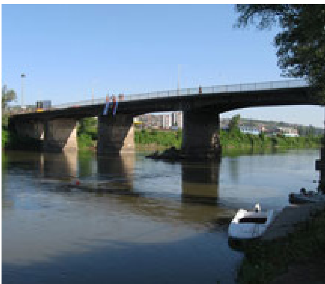
Мост на ријеци Босни