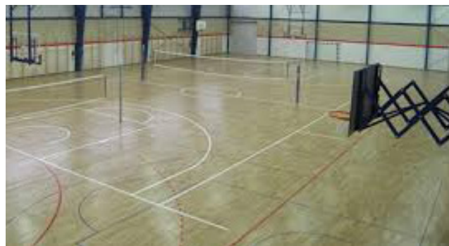
Спортска дворана ОШ „Вук Стефановић Караџић“ Добој